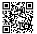
修了証再交付 フォーム

※記載事項変更の方は、旧修了証を当法人に送付ください。旧修了証受領後の発送となります。