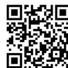
勤務先変更申請 フォーム

・勤務先名 ・勤務先住所 ※勤務先変更が確定した時点で、変更申請をお願いします。